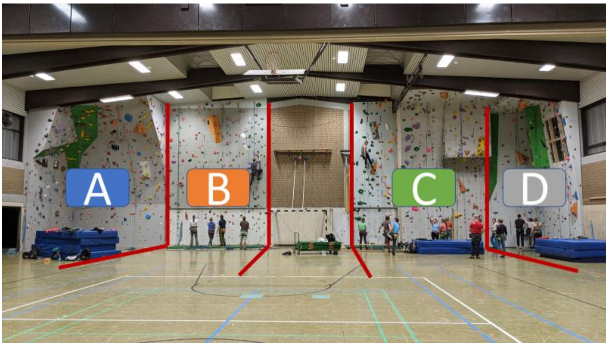
Darstellung der 4 Klettersektoren A - D in der Kletterhalle des Deutschen Alpenvereins Sektion Hameln